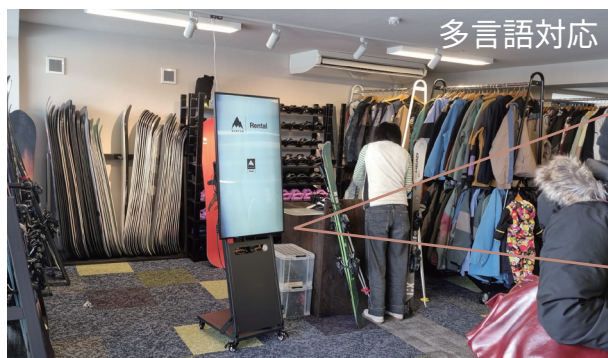
※白馬 岩岳リゾート SPICY 様